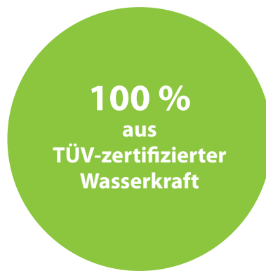
AhrtalStrom der Ahrtal-Werke GmbH

506 g CO 2 -Emissionen pro kWh 0,0007 g/kWh radioaktiver Abfall